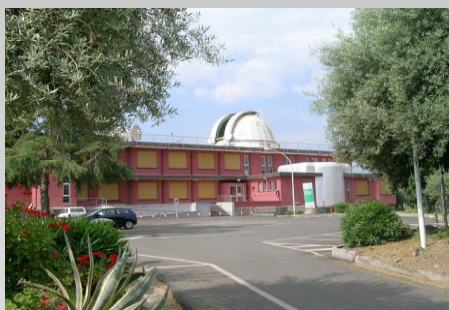
Observatoire astrophysique de Catane