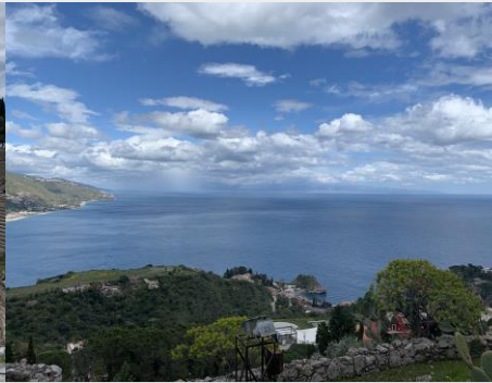
Vue sur la mer Ionienne