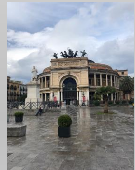
Le centre ville de Palerme

Il est conseillé de trouver un hébergement proche de la ville de Catane où se situe l'aéroport International qui est desservi par les grands aéroports ( Paris – Lyon – Marseille – Nantes – Bruxelles ) avec des tarifs à partir de 25€ avec EasyJet.