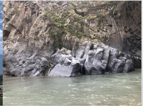
Rivière que s'écoule au pied de l'Etna

Durant ce séjour, nous proposerons aussi d'autres visites comme le théâtre gréco-romain de Taormine avec sa vue magnifique sur la mer Ionienne , la vallée des temples proche de la ville d' Agrigento avec ses magnifiques édifices dans un état de conservation exceptionnel, les villes de Catane et de Palerme , les mosaïques de la Villa Romana del Casale ou même un « outlet » pour faire des emplettes à des tarifs très intéressants.