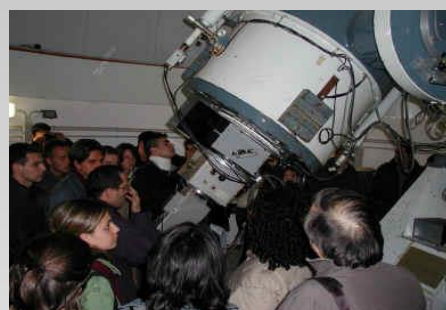
Télescope de l'observatoire de Serra La Nave