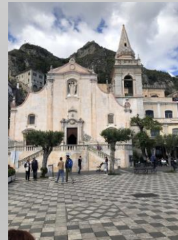
La place de Taormine