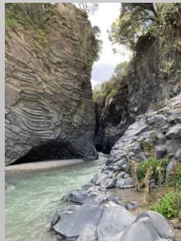
Les strates au pied du volcan