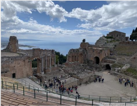
Le cirque antique de Taormine

Le second objectif de ce séjour est de découvrir la magie des volcans . Il sera possible de s'approcher d'un des quatre cratères actifs de l'Etna . Selon votre forme et votre envie, en option, vous pourrez opter pour une excursion en 4X4 ou pour une randonnée de 6h et 500m de dénivelé positif. Pour la découverte du Stromboli , là aussi, en option, vous opterez pour une promenade en bateau ou une longue marche de plusieurs heures d'approche afin de distinguer la lave en fusion .