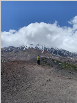
Le mont Etna

Durant ce séjour, nous proposerons aussi d'autres visites comme le théâtre gréco-romain de Taormine avec sa vue magnifique sur la mer Ionienne , la vallée des temples proche de la ville d' Agrigento avec ses magnifiques édifices dans un état de conservation exceptionnel, les villes de Catane et de Palerme , les mosaïques de la Villa Romana del Casale ou même un « outlet » pour faire des emplettes à des tarifs très intéressants.