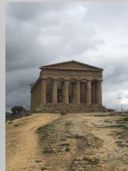
Le temple d'Agrigento