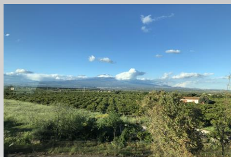
Vue de l'Etna depuis le Sud

Astro Evasion , en partenariat avec Cap Astro , vous propose ce séjour Hélio-Volcans en Sicile afin de découvrir la qualité du ciel sicilien pour l'observation solaire et ses deux volcans, l'Etna et le Stromboli. Le premier objectif de ce séjour est de faire de l'imagerie solaire sur les pentes de l'Etna à une altitude de 1700 mètres et de profiter des conditions atmosphériques exceptionnelles pour exploiter le maximum du matériel et d'obtenir des images d'une qualité à couper le souffle. C'est d'ailleurs pour cette raison que l'Observatoire d'Astrophysique de Catane y a installé un observatoire qui réalise des observations solaires régulières depuis 1879 à une altitude de 1735 mètres sur les pentes de l'Etna .